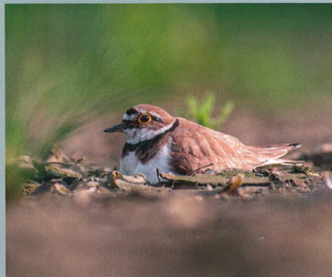
Hnízdění kulíka přivedlo místní úředníky na myšlenku možného pravidelného letnění zdejších rybníků

Kromě kulíků jsem na rybníce několikrát zaznamenal čápa černého nebo čejku chocholatou, což jsou ve Středočeském kraji poměrně vzácné druhy. V okolí také úspěšně vyhnízdilo několik konipasů horských, což jen potvrzuje, že i vypuštění malého rybníka kousek od Prahy dokáže vytvořit atraktivní lokalitu, kde mohou hnízdit i v naší krajině stále vzácnější druhy ptáků. Lukáš Zdražil, 15 let, Světlice