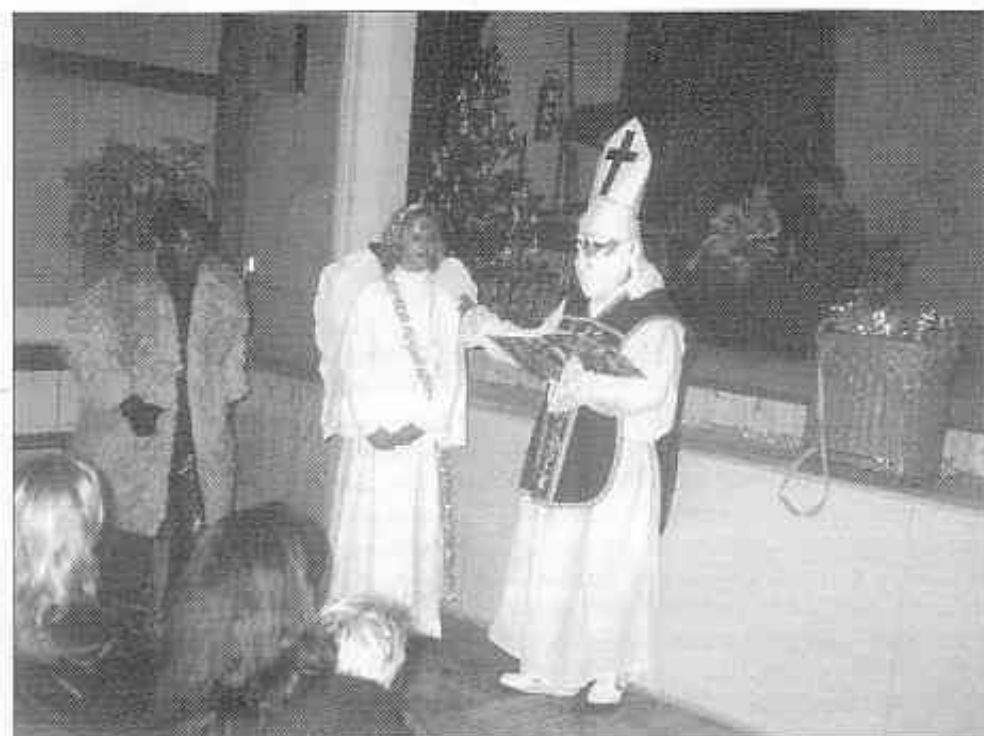
Obě zveřejněné fotografie zachycují atmosféru Mikulášské besídky, která se uskutečnila 9. 12. 2000 v KD v Podolí.