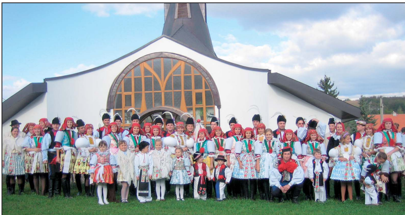
Letošní slovácké hody v Podolí se uskutečnily za chladnějšího počasí, přesto byly tradičně hojné a veselé.