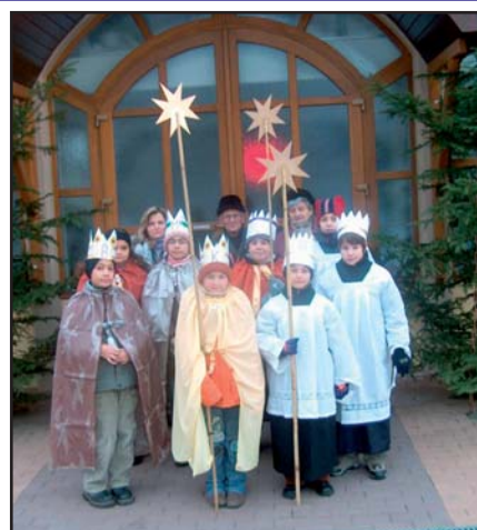
Organizátoři Tříkrálové sbírky vykoledovali letos v Podolí pro Charitu 15100,50 Kč.