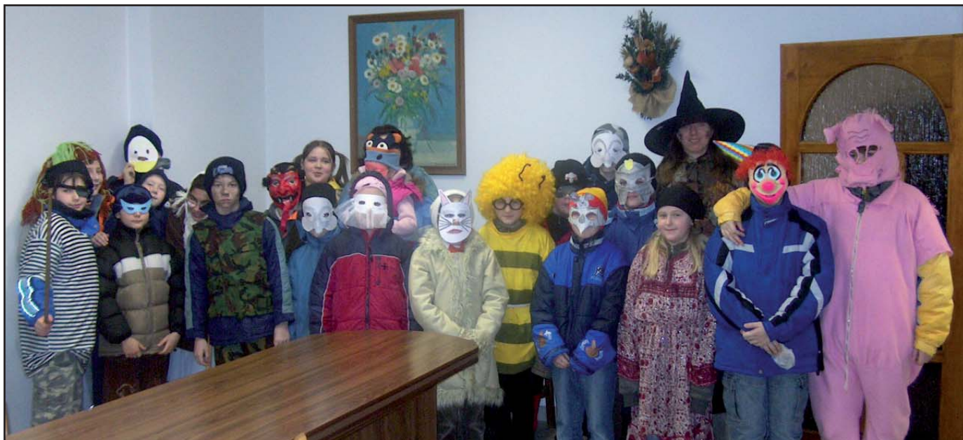
Ve středu 6. února navštívil fašankový průvod dětí z místní základní školy Obecní úřad v Podolí.