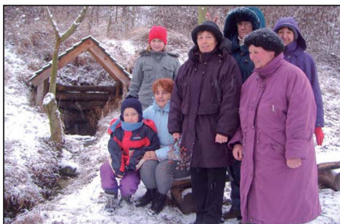
Početnější skupina účastníků letošního výšlapu se vydala k přehradě do Míkovic, méně početná skupina, zachycená na fotografii, se prošla k popovské studánce.