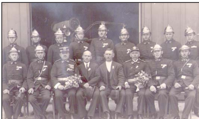
Sbor dobrovolných hasičů v roce 1943