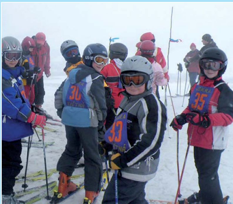
Naši reprezentanti na závodech „Štrbáňský Ďas“