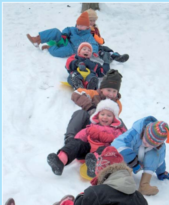
Ale závodit se dá pochopitelně mnoha způsoby