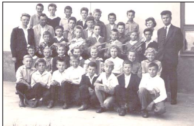
Žáci Lidové školy v Podolí (byla zřízena při Osvětové besedě v Podolí) někdy kolem roku 1961.