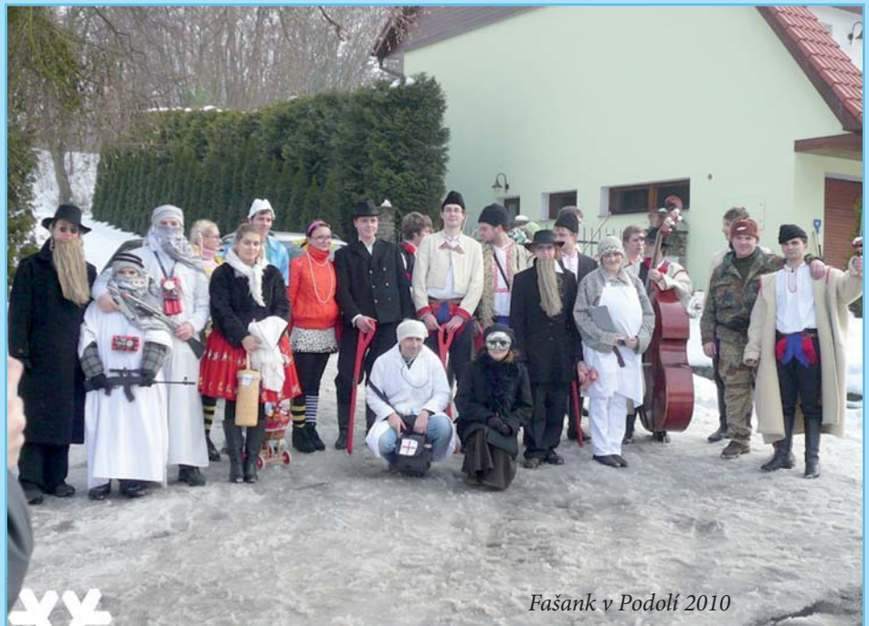
Fašank v Podolí 2010