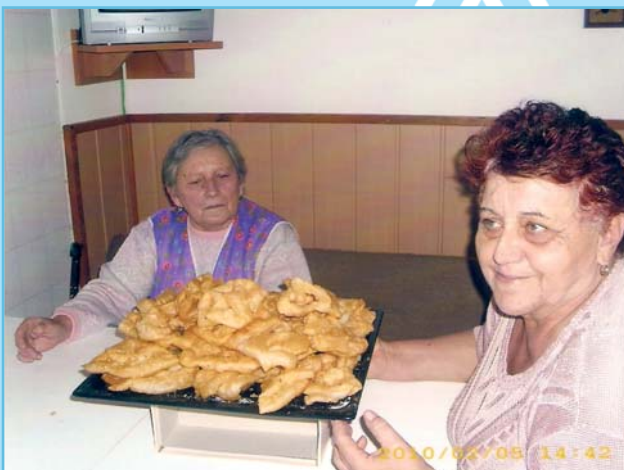
K Fašanku patří i smažení božích milostí (suků)

• Příští sběr použitých PET láhví bude v sobotu 27. března 2010 od 15.00 do 17.00 hodin v průjezdu základní školy v Podolí.