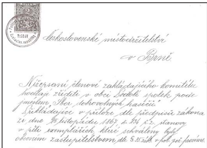
Ukázka z dopisu Československému místodržitelství v Brně z roku 1924 o založení Sboru dobrovolných hasičů