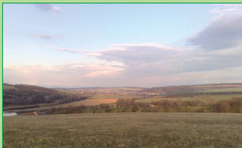
Jaro přichází do Podolí