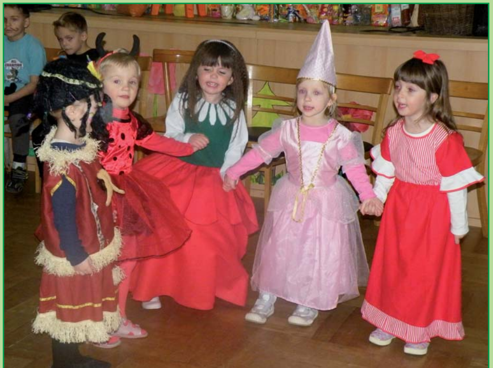
Vzpomínka na dětský karneval 2010