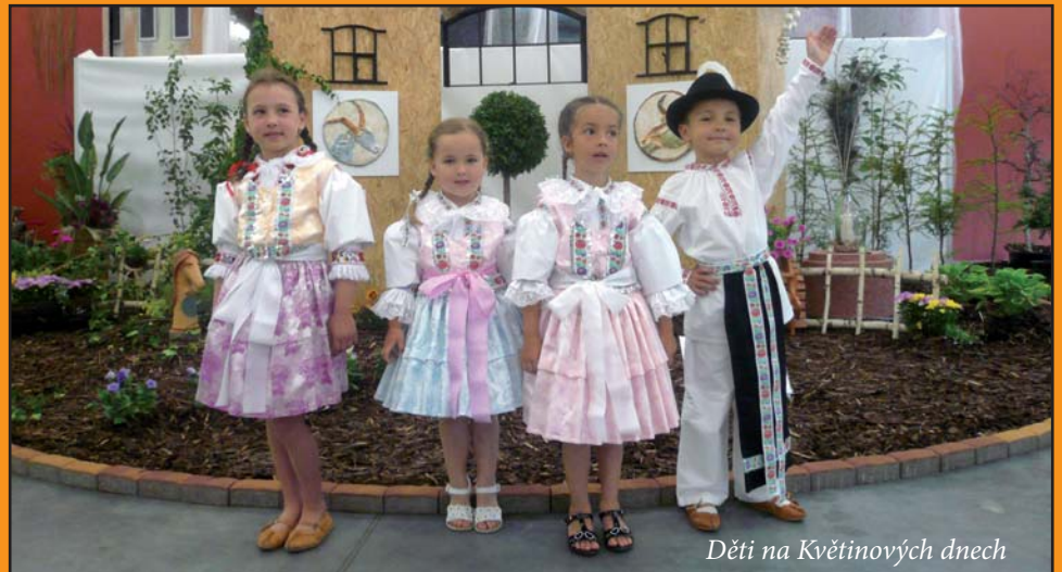
Děti na Květinových dnech