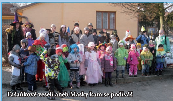
Fašankové veselí aneb Masky kam se podíváš