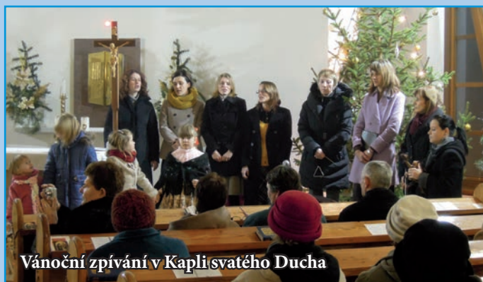
Vánoční zpívání v Kapli svatého Ducha