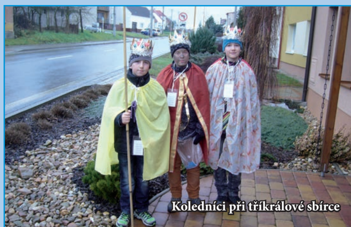
Koledníci při tříkrálové sbírce