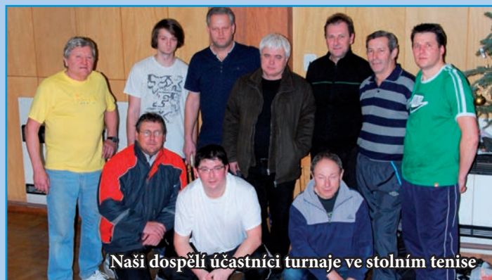
Naši dospělí účastníci turnaje ve stolním tenise