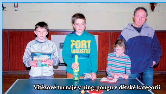
Vítězové turnaje v ping-pongu v dětské kategorii

Vydává obec Podolí ©2013 nákladem 340 ks