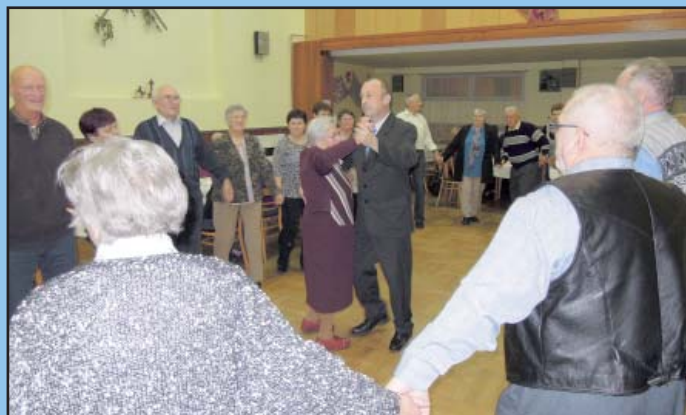
Beseda s důchodci