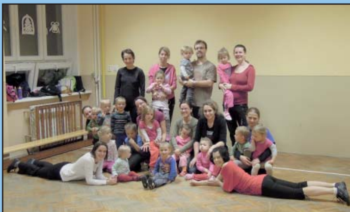
Hravé cvičení pro rodiče a děti