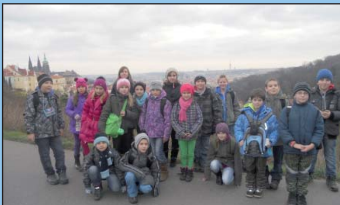
Naši školáci v Praze