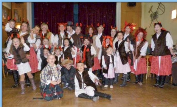
Frišky a Fričata na Sokolské Mikulášské besedě u cimbálu