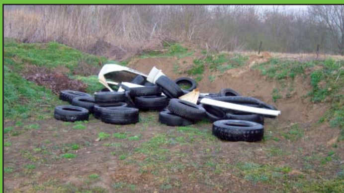
Černá skládka v Lipínách