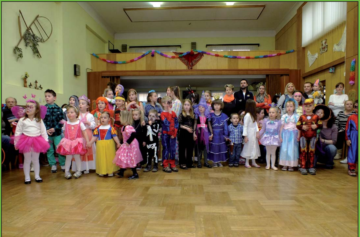
Karneval v kulturním domě