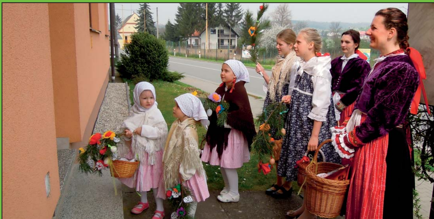
Královničky aneb Nosení létečka