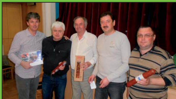
Ocenění účastníci koštu slivovice