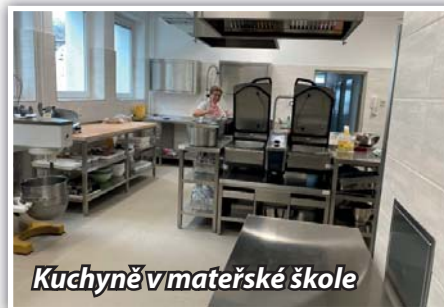
Kuchyně v mateřské škole