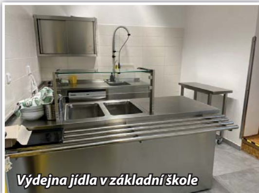
Výdejna jídla v základní škole