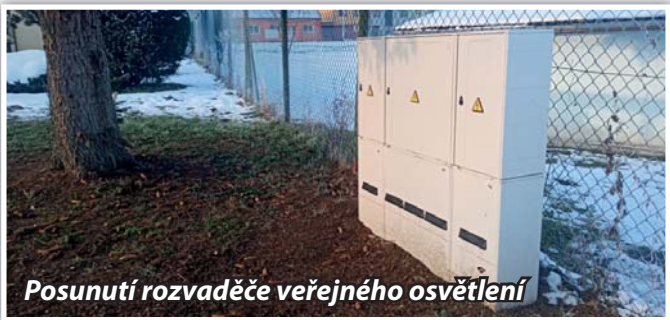
Posunutí rozvaděče veřejného osvětlení