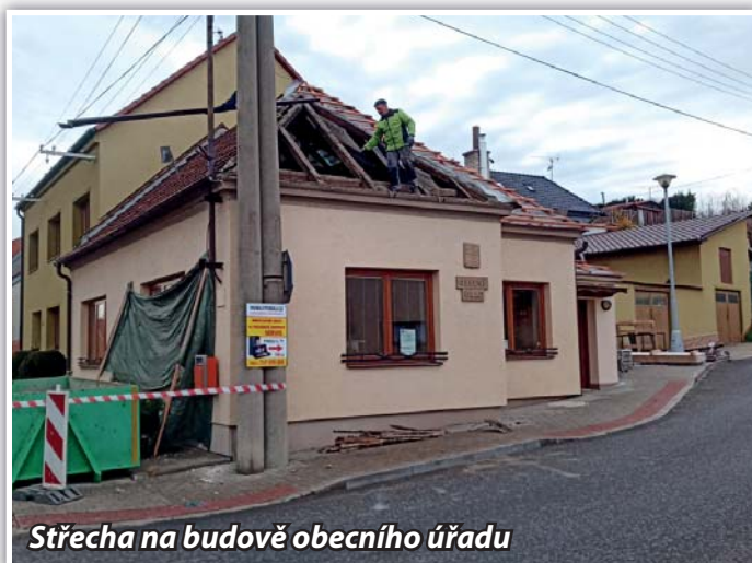
Střecha na budově obecního úřadu