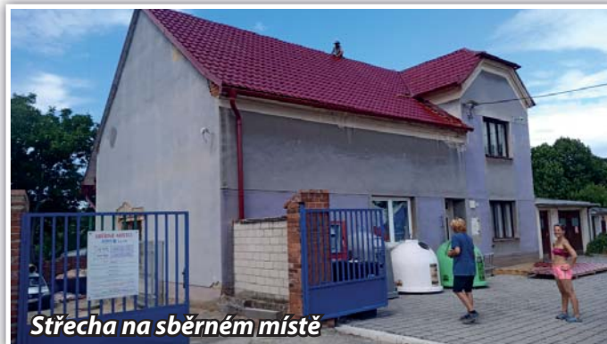
Střecha na sběrném místě