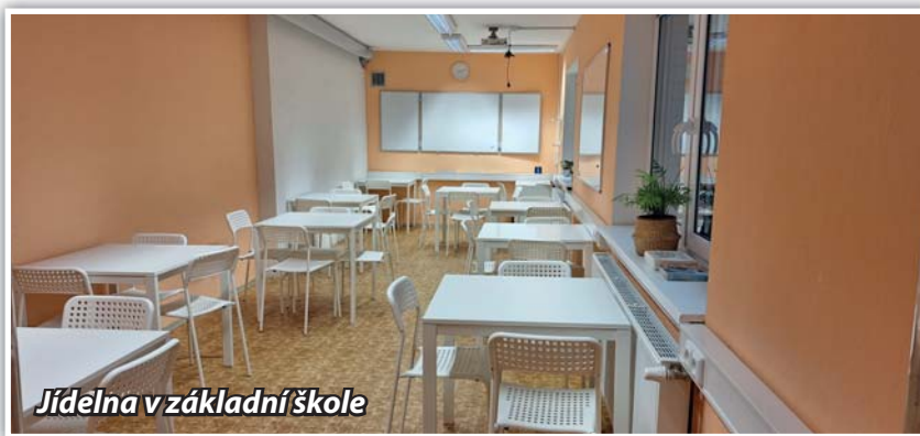
Jídelna v základní škole