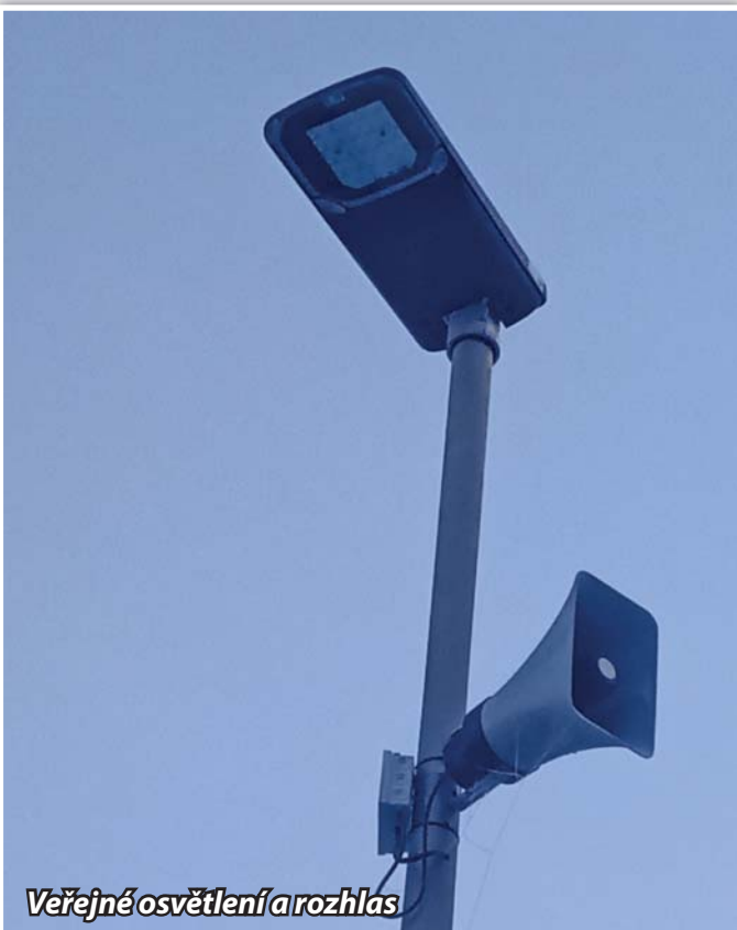
Veřejné osvětlení a rozhlas