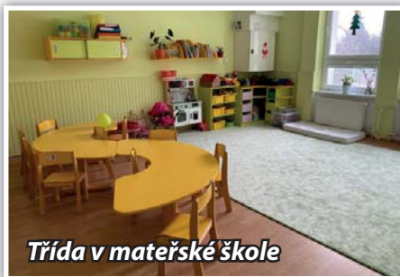
Třída v mateřské škole