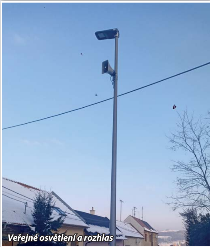
Veřejné osvětlení a rozhlas