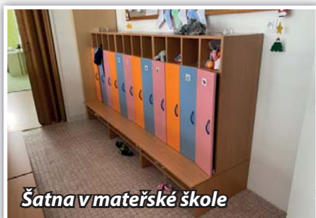
Šatna v mateřské škole