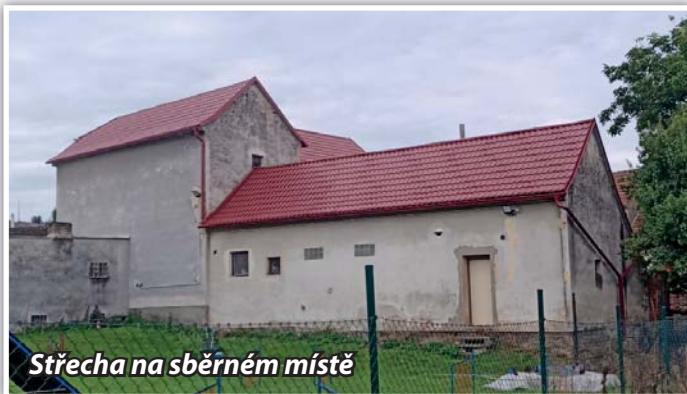
Střecha na sběrném místě