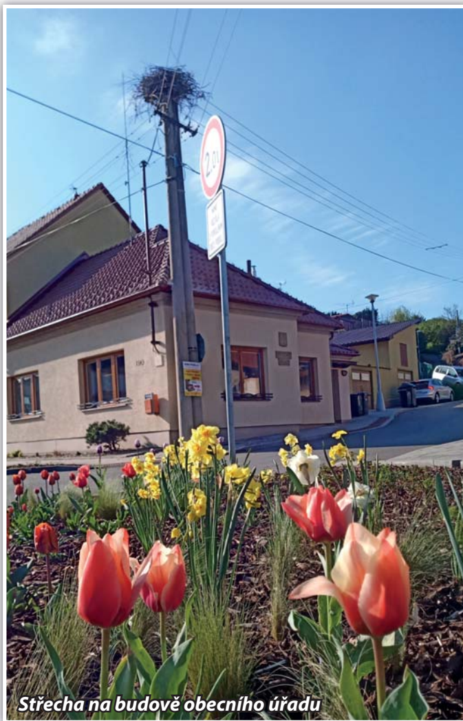
Střecha na budově obecního úřadu