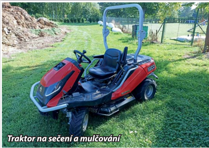
Traktor na sečení a mulčování