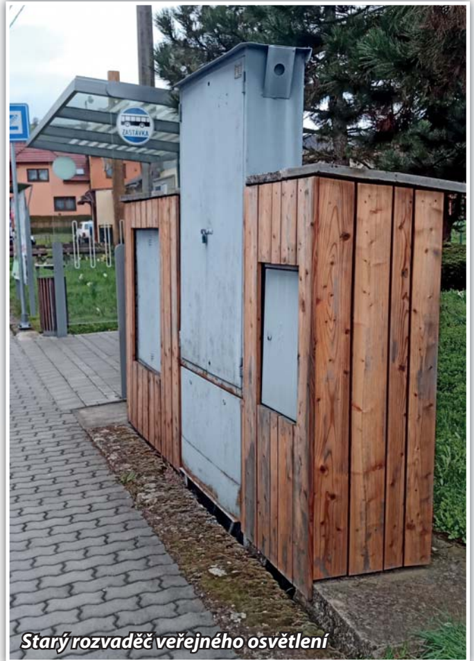
Starý rozvaděč veřejného osvětlení