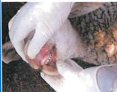
Změny v dutině ústní

V případě zjištění výše uvedených příznaků ihned kontaktujte soukromého veterinárního lékaře nebo příslušnou krajskou veterinární správu .