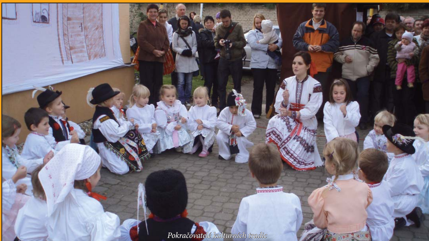
Pokračovatelé kulturních tradic

Vydává obec Podolí ©2011 nákladem 340 ks. Redakční rada (telefon: 608 705 635)