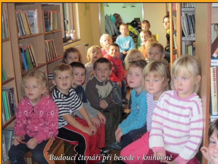
Budoucí čtenáři při besedě v knihovně