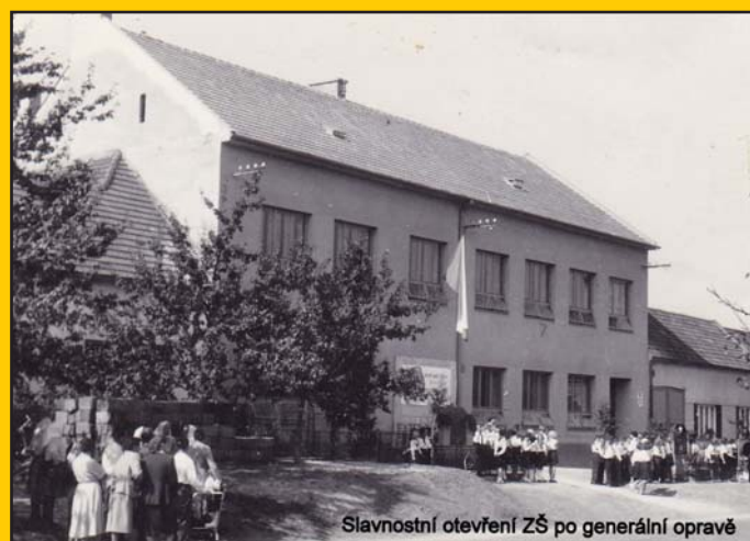
Slavnostní otevření Základní školy po generální opravě v roce 1958