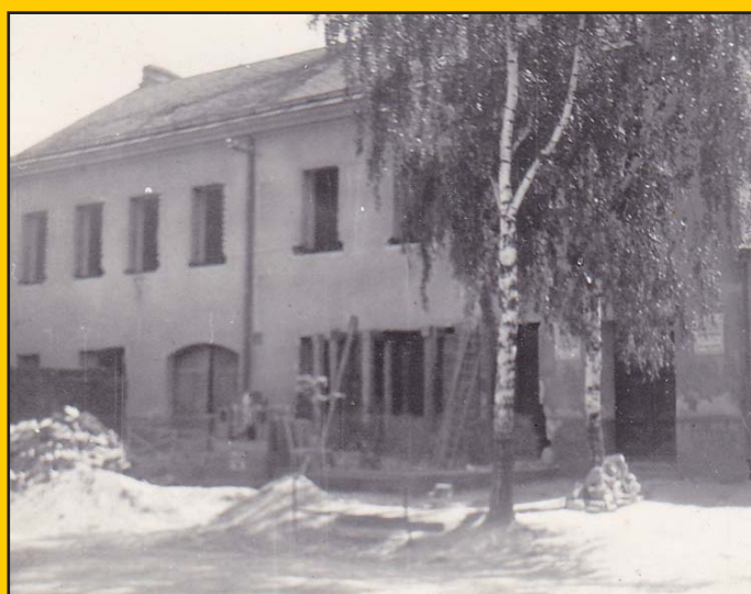
Škola v Podolí v průběhu generální opravy v roce 1957