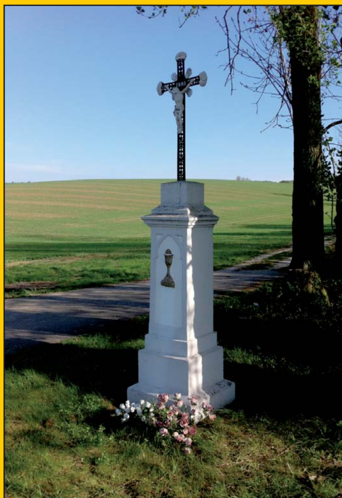
Kříž na hranici podolského katastru