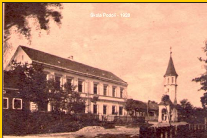
Pohlednice z Podolí