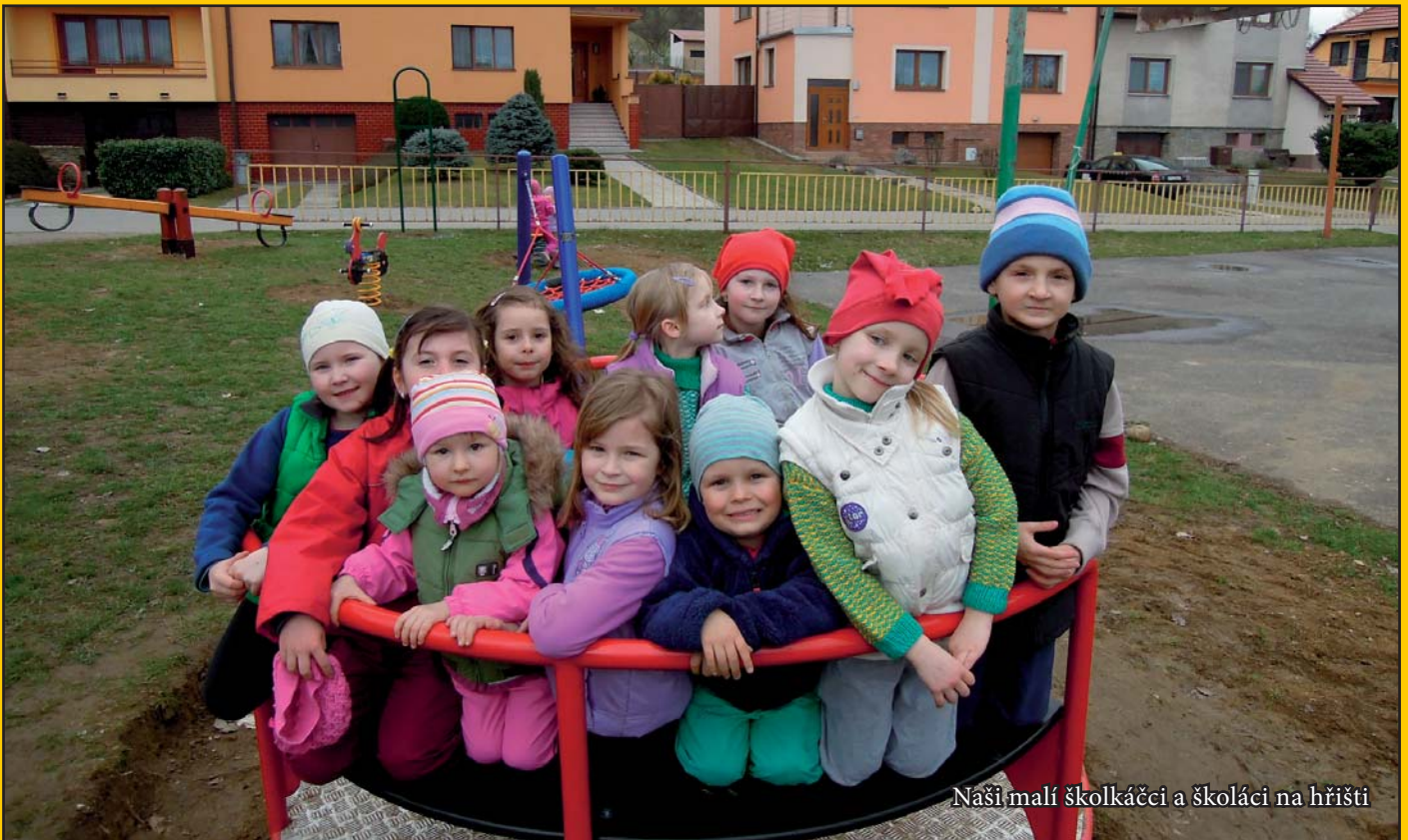
Naši malí školkáčci a školáci na hřišti